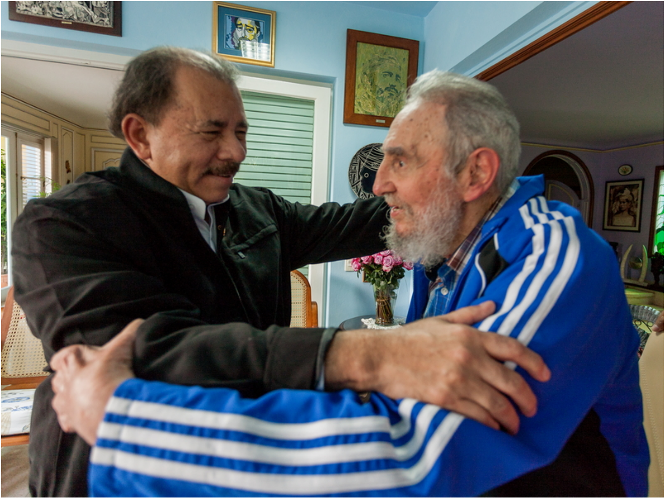
Daniel Ortega con un Fidel Castro anziano e malato, nel 2014..