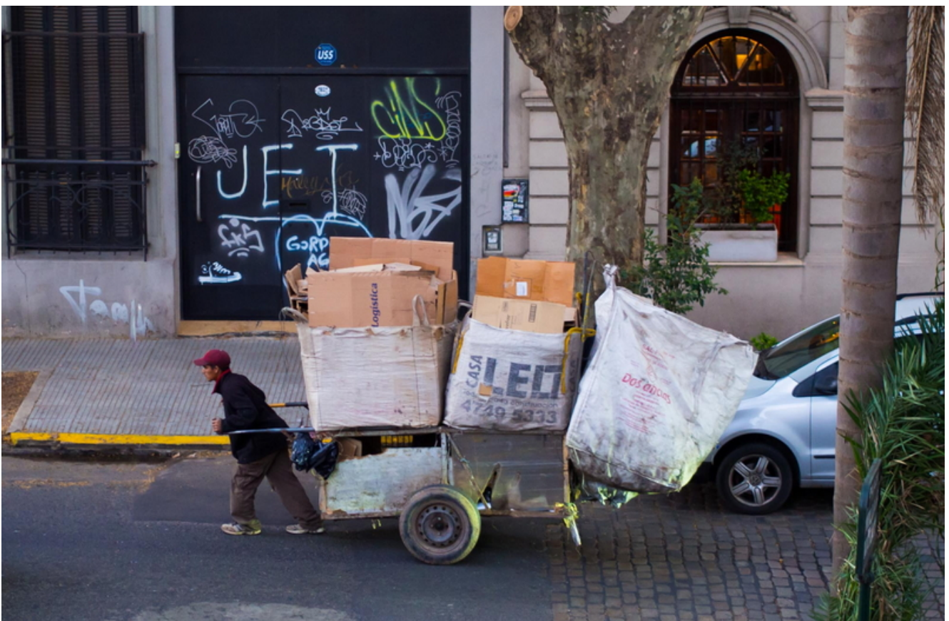
Un cartonero per le strade di Buenos Aires; oggi in Argentina i poveri sono 17 milioni (il 43 per cento della popolazione).