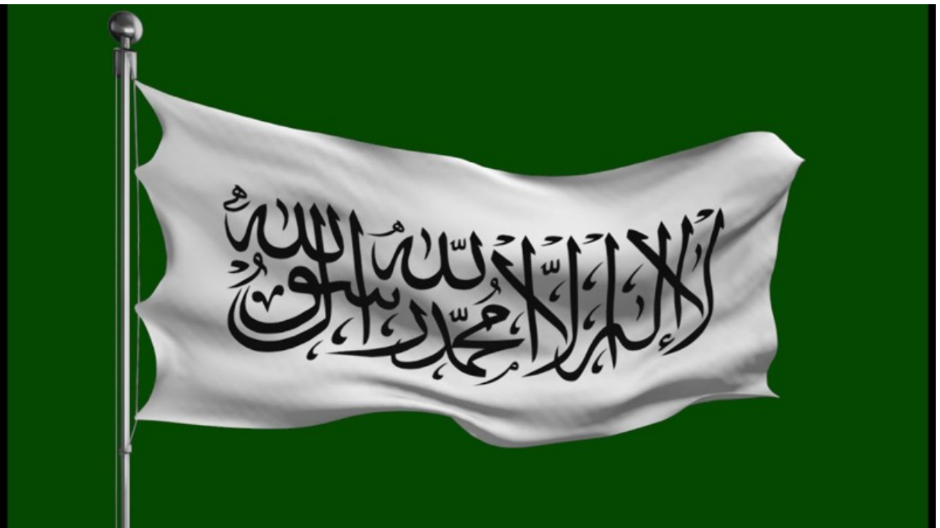
La bandiera ufficiale dei Talebani, tornati al potere in Afghanistan.