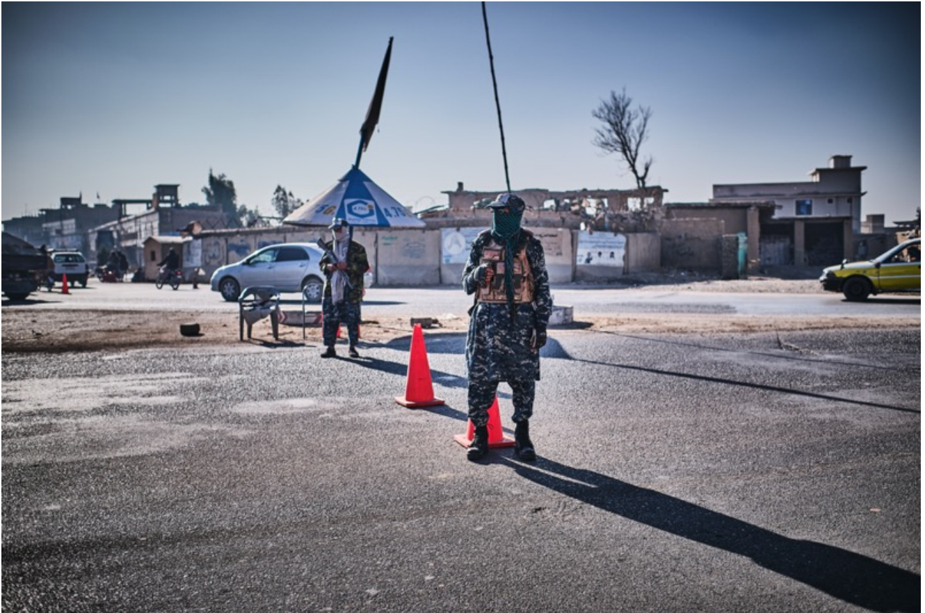
Talebani a un check point, a Kandahar.