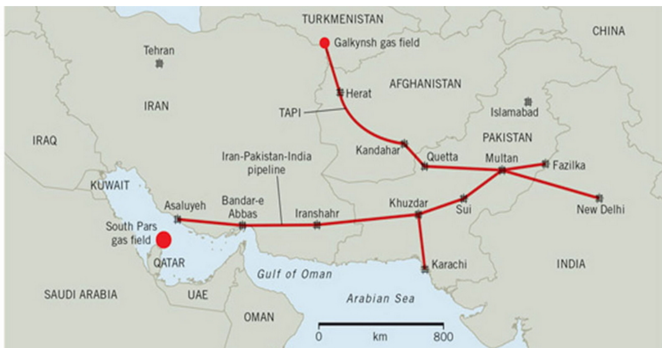
Mappa dell'oleodotti TAPI

un paese troppo grande e soprattutto troppo armato e organizzato per essere aggredito direttamente o per essere fatto implodere dall'interno. Ma l'idea di stringerlo a tenaglia fra tre paesi alleati degli Stati Uniti (Iraq, Afghanistan, Pakistan) deve essere stata seducente, quantunque l'arma più utilizzata per piegare l'Iran ai voleri delle potenze occidentali siano state le sanzioni economiche. E qui veniamo al terzo ambito d'indagine, quello economico, che va analizzato ogni volta che ci si trova di fronte a un conflitto armato.