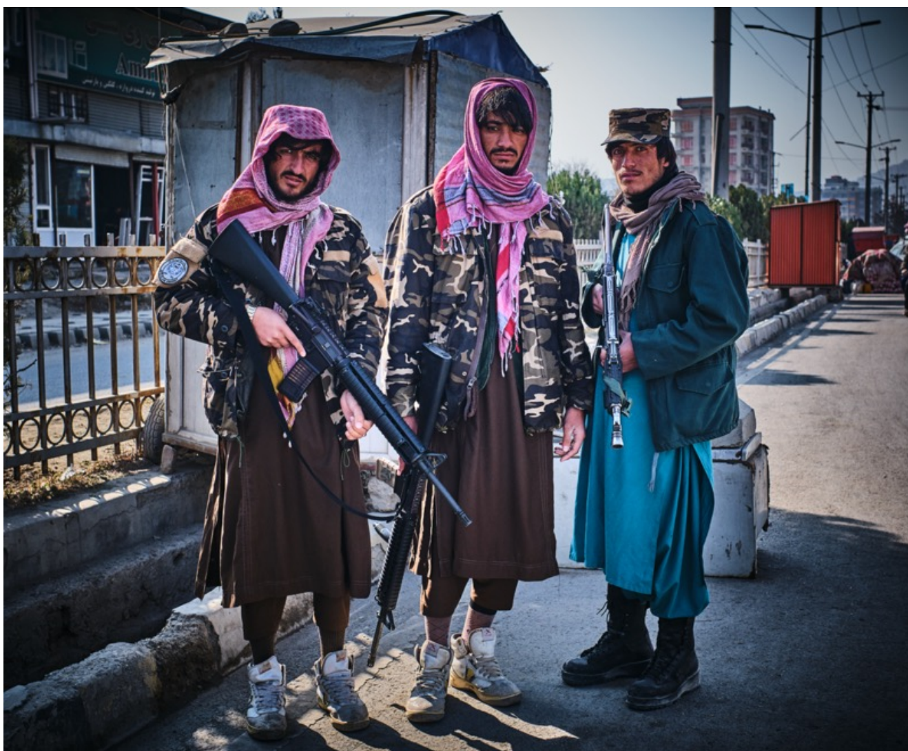
Un gruppo di giovani Talebani di pattuglia al centro di Kabul.

L'attesa continua. La notte fa molto freddo, siamo a metà percorso ora, in un tunnel fatto di lamiera e rete metallica. C'è ghiaccio ovunque, impossibile dormire, ci stringiamo l'uno all'altro avvolgendoci con coperte di lana. Alcuni ragazzini passano vendendo tè caldo e qualcosa da mangiare. Sono passate 24 ore dall'inizio della mia fila. Approfittando del buio e di alcuni buchi nella recinzione, dalle colline intorno arrivano uomini e ragazzi che provano a passare illegalmente. La gente è solidale con loro, fanno spazio serrando le fila. Qualcuno non è abbastanza veloce e viene visto, picchiato e trascinato via, ributtato al di là della rete.