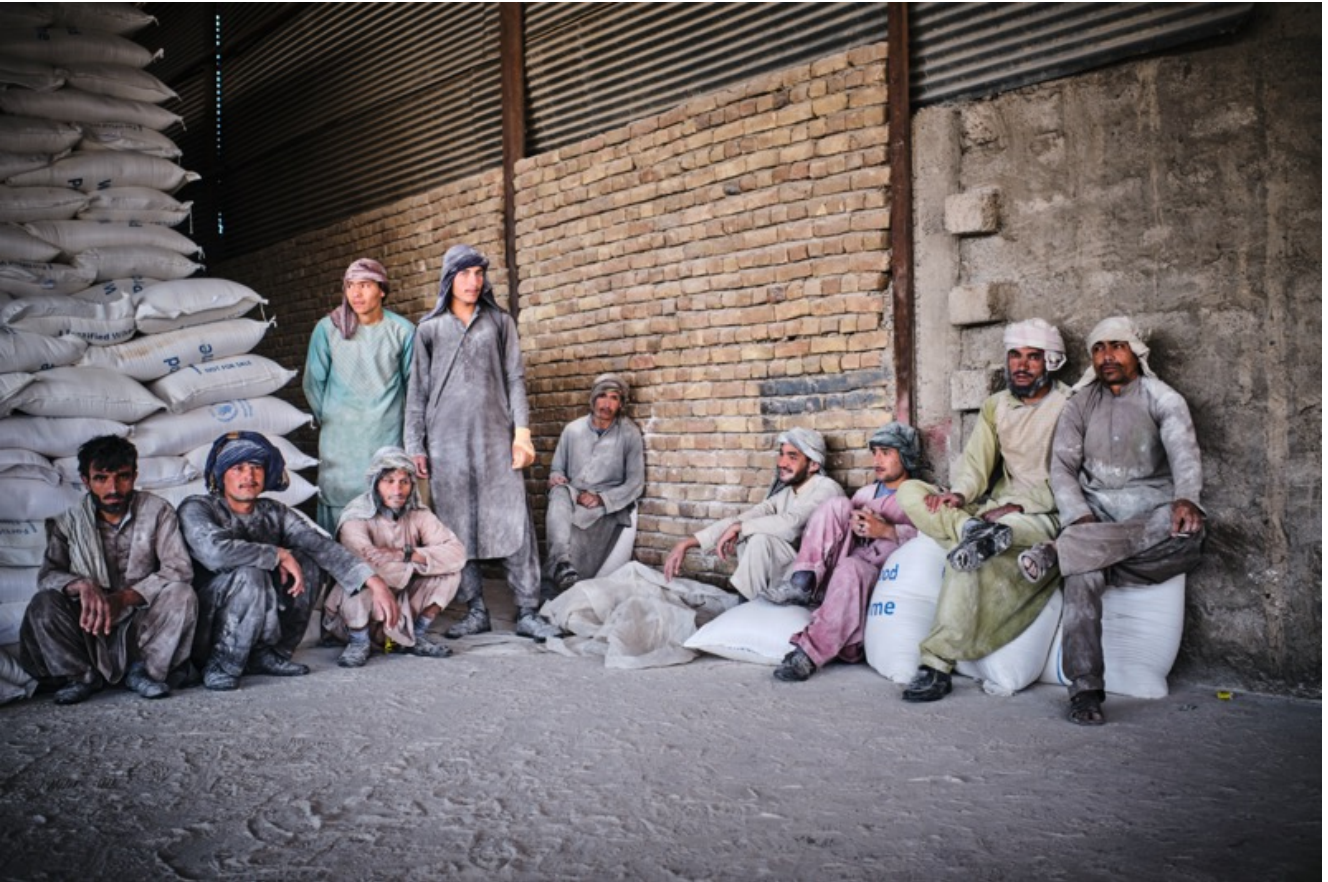
Un gruppo di uomini si riposa dopo aver scaricato centinaia di sacchi di farina destinati ai bisognosi presso il centro di distribuzione del Wfp.