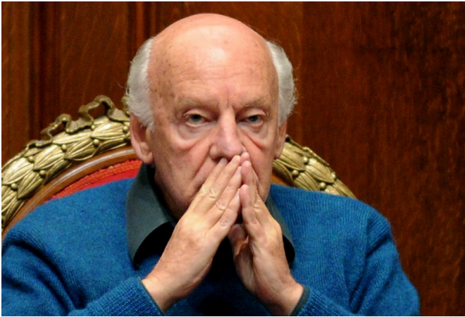
Eduardo Galeano

Solo adesso ho letto l'articolo su Galeano, contenuto nel numero di dicembre della rivista. Sono allibito nel leggere le dichiarazioni di Gianni Minà sul Venezuela, e soprattutto a leggerle su una rivista come Missioni Consolata. Quanto viene detto dai giornali occidentali, compreso il nostro Avvenire , sulla disastrosa situazione dei diritti umani dei venezuelani viene trattato con disprezzo dal giornalista. Le recenti elezioni della Costituente sono state vinte da Maduro? Ma queste elezioni sono state illegali, il presidente Maduro non aveva nessun diritto di eliminare il Parlamento, eletto comunque democraticamente, in un paese dominato prima da Chavez e adesso dall'ex camionista Maduro, e di sostituirlo con la Costituente. L'opposizione non ha potuto fare niente per fermare lo strapotere dei chavisti e decine di persone sono state uccise dalla polizia durante le manifestazioni di protesta in difesa della democrazia. I venezuelani sono alla fame, già decine di bambini sono morti di stenti e la colpa non è certo dei cosiddetti «servizi di intelligence nordamericani». La colpa è dell'arroganza del potere e dell'incapacità di far fronte ai bisogni della popolazione, ridotta a fare lunghissime code di fronte a negozi che non hanno quasi nulla da vendere. D'altronde, Gianni Minà è ben conosciuto per la sua amicizia con Fidel Castro prima e adesso con Raùl, il fratello che ha preso il potere. I cubani stanno un po' meglio dei venezuelani, per loro fortuna, ma Gianni