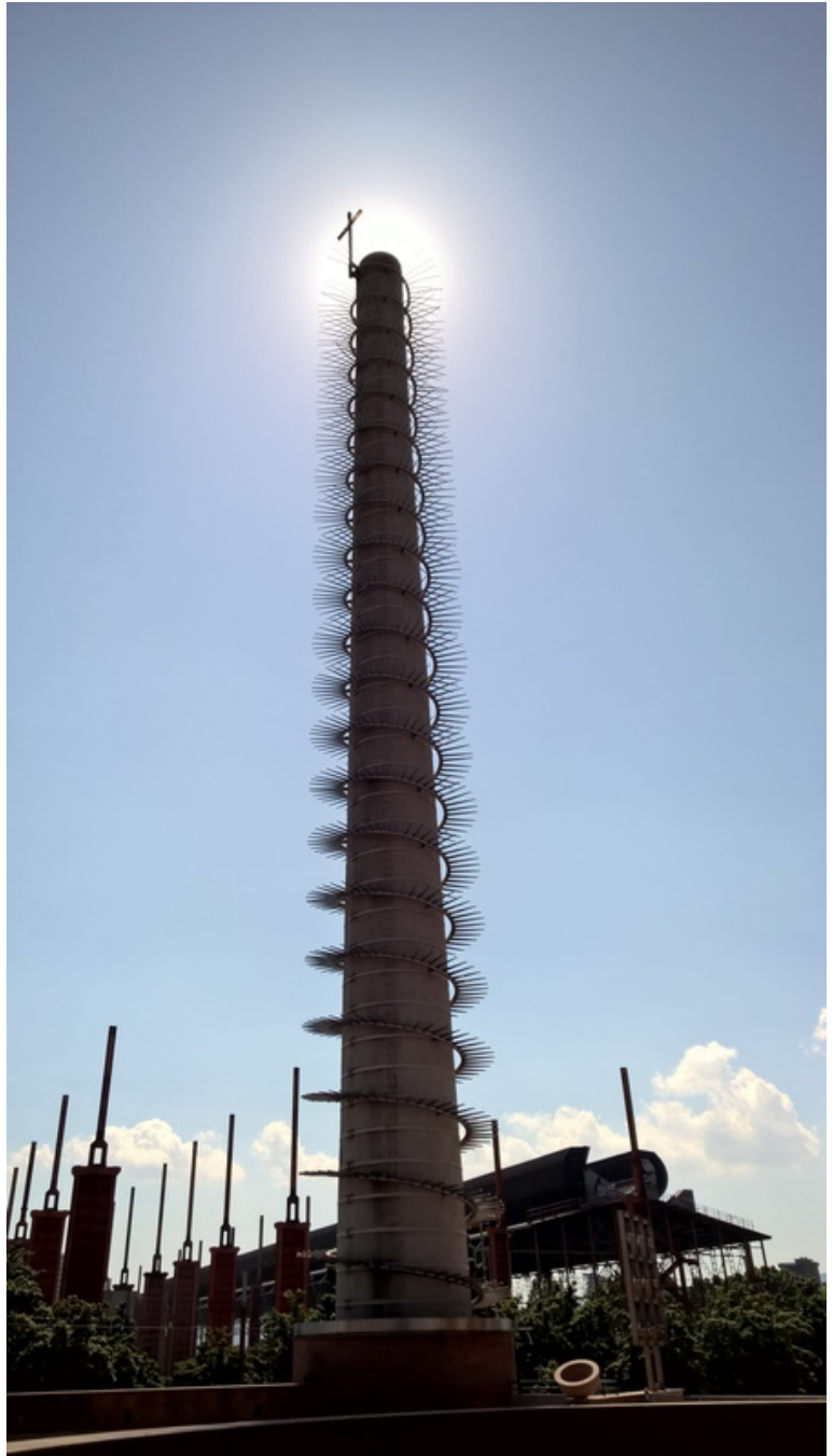
Ciminiera campanile del Santo Volto – Torino

È la domanda esistenziale che la commissione d'inchiesta inviata dal sinedrio pone a Giovanni: «“Tu, chi sei?” Egli confessò e non negò. Confessò: “Io non sono il Cristo”. Allora gli chiesero: “Chi sei, dunque?”» (Gv 1,19-21). La domanda posta dalla commissione a Giovanni «Chi sei tu?» (Gv 1,19 e 22; cf 8,25; 21,12), è la domanda che attraversa la storia di ciascuno di noi, perché ci obbliga all'individuazione della nostra identità. In altre parole: io devo sapere chi sono . Non