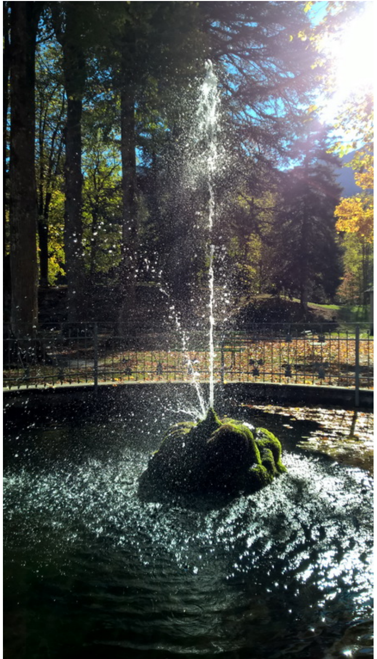
Autunno in Certosa di Pesio

Il profeta Elia fa l'esperienza della «voce di silenzio sottile – qol demamàh daqqàh », che lascia sbigottiti, perché non capiamo il senso della «sottigliezza» del silenzio che già da sé esprime una intensità assoluta. Il silenzio è anche sottile, come se volesse essere ancora più silente: «Dopo il fuoco, una voce di silenzio sottile (la Bibbia-Cei, 2008 traduce in modo banale brezza leggera). Come l'udì [udire il silenzio!] Elia si coprì il volto con il mantello, uscì e si fermò all'ingresso della caverna» (1Re 19,12-13). L'esperienza