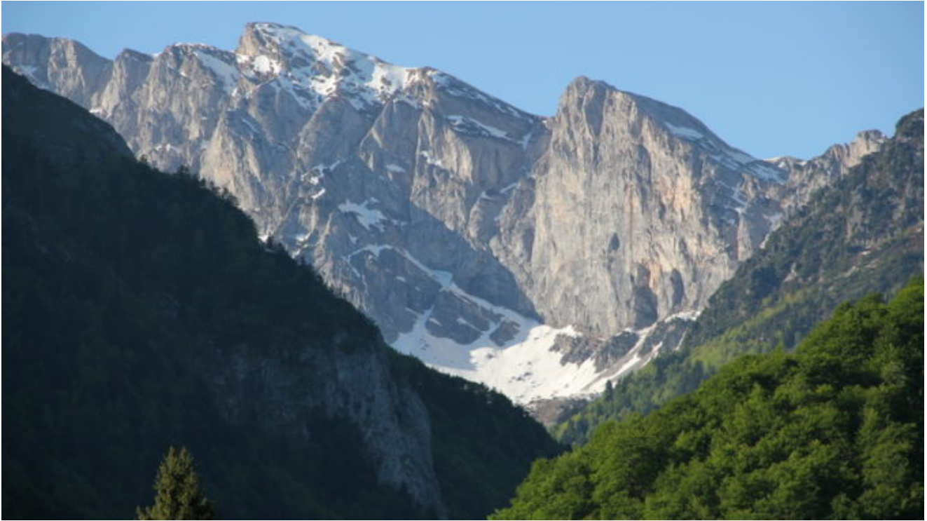
Valle Pesio, Marguareis