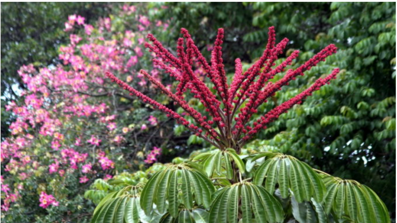
Schefflera actinophylla