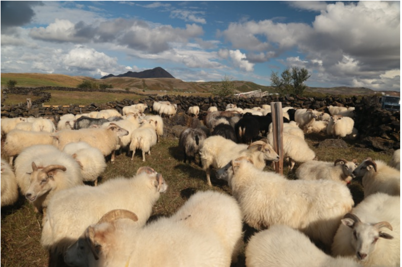
Un gregge di pecore a Hverir.