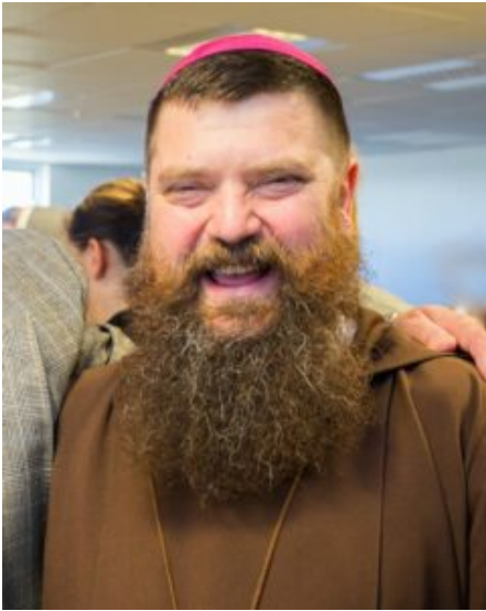
Mons. Dávid Bartimej Tencer, vescovo della Chiesa cattolica islandese.

In termini percentuali, la Chiesa cattolica islandese è la più grande tra quelle dei paesi del Nord Europa, tutti dominati dalle Chiese luterane. Dal 2015 la comunità cattolica è guidata da monsignor Dávid Bartimej Tencer, dell'ordine dei frati minori cappuccini.