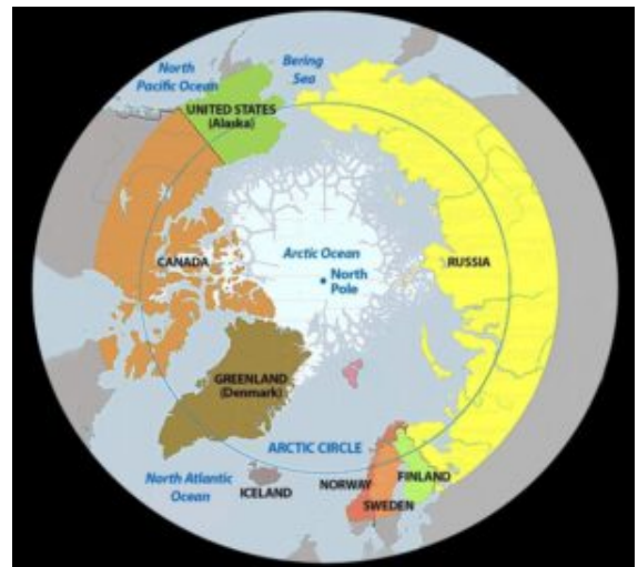
Mappa con l'Islanda e gli altri paesi del Circolo polare artico.