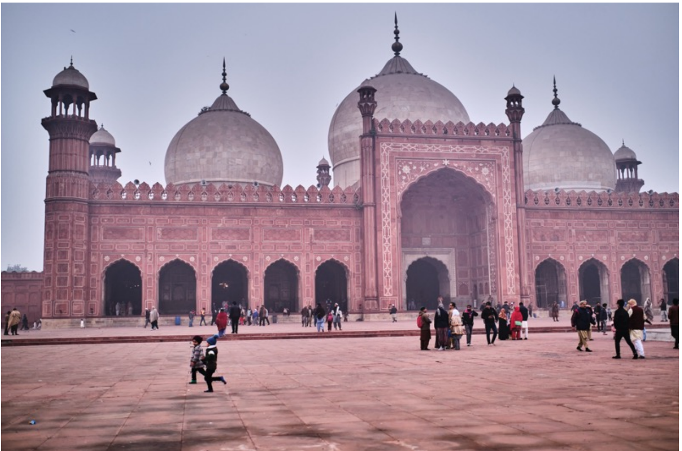
La Moschea di Masjid Baadshahi conosciuta anche come la

Dopo questo ennesimo attentato, e in vista delle elezioni dell'8 febbraio , la tensione in Pakistan cresce giorno dopo giorno. Continui sono gli arresti. Il 13 gennaio, a Peshawar sono stati fermati due sospetti terroristi, mentre pianificavano un attacco suicida contro una scuola sciita. L'opinione comune, largamente condivisa, è che le elezioni non si potranno tenere a febbraio, ma verranno posticipate a data da destinarsi.