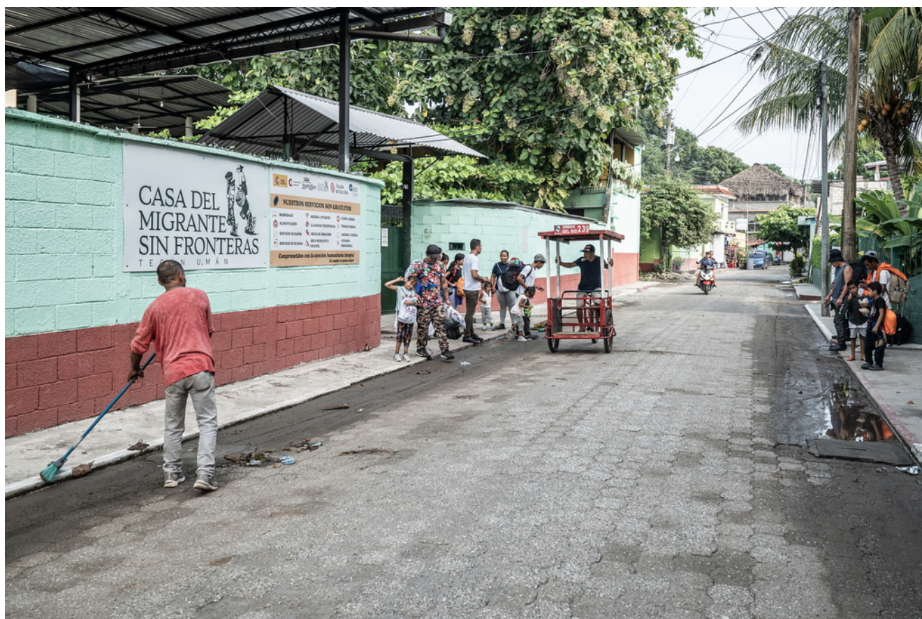
Migranti all'esterno della «Casa del migrante sin fronteras» di Tecún Umán.

Ma, in fondo, non è tanto il Suchiate a preoccupare i migranti come Linda e le sue bambine, quanto il pensiero di mettere piede in Messico.