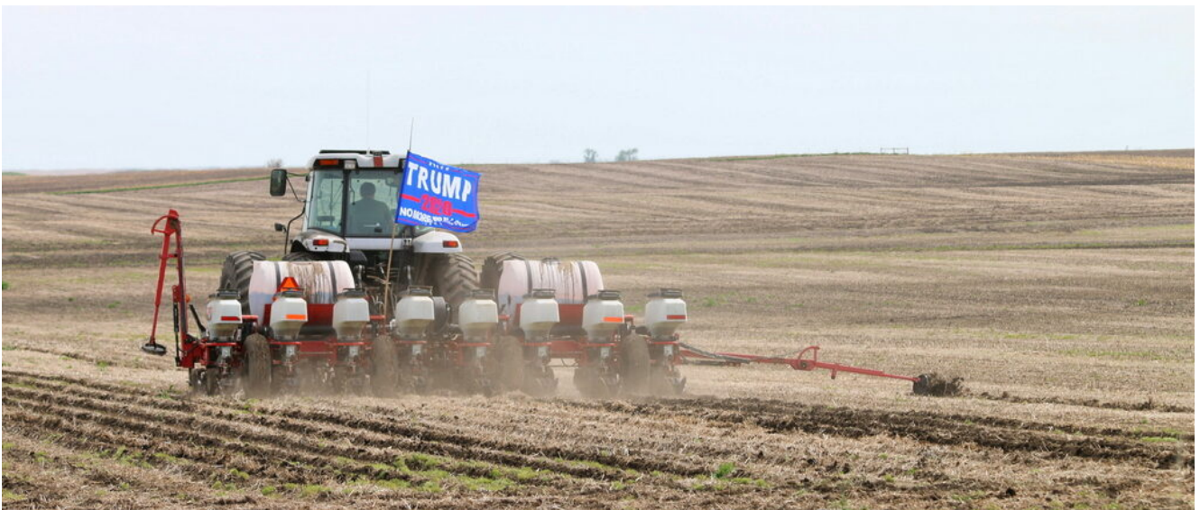
Un agricoltore Usa con la bandiera trumpiana.

In cima alla lista dei paesi nemici compilata da Trump, compare senz'altro la Cina , alla quale già nel precedente periodo di presidenza (dal 2016 al 2020), erano stati applicati numerosi dazi doganali come tentativo di limitare le sue esportazioni verso gli Stati Uniti e, quindi, la sua espansione economica.