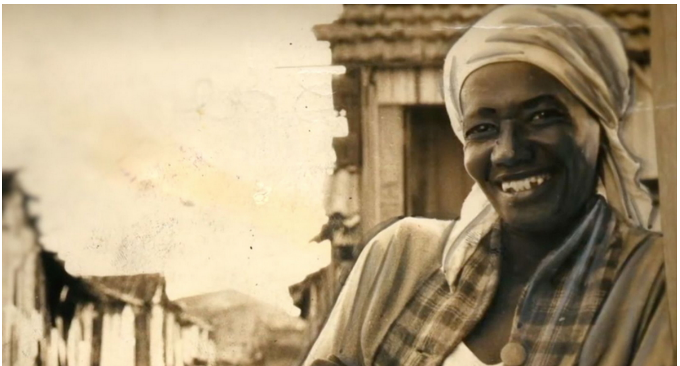
Il sorriso di Carolina Maria de Jesús (1914-1977), favelada di San Paolo e scrittrice.