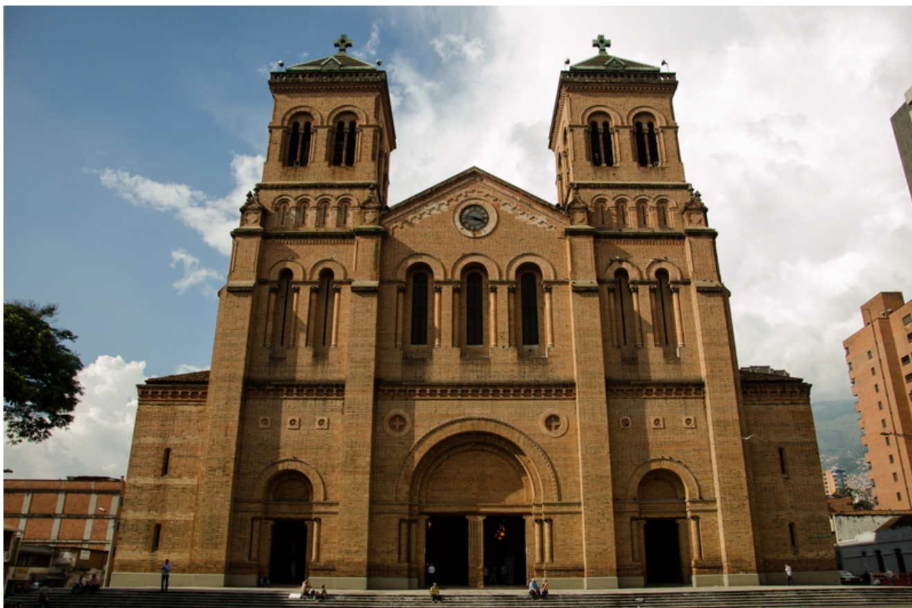
La facciata della cattedrale dell'Immacolata Concezione, a