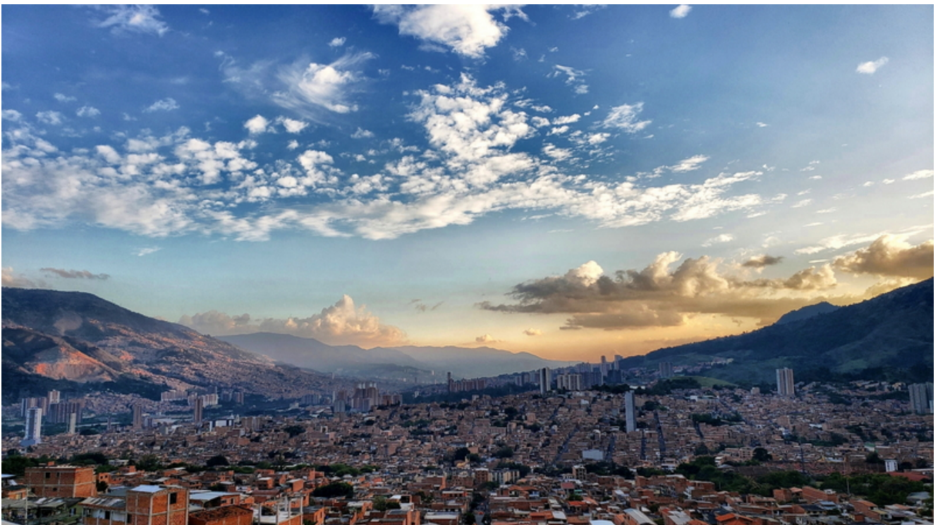
Una vista panoramica di Medellin.

Un fenomeno che attirò l'attenzione dell'Eln (Esercito di liberazione nazionale) che pensò di poter controllare questi gruppi estendendo e rafforzando la sua presenza a Medellín, punto strategico nella Valle di Aburrà e di tutto il dipartimento di Antioquia. All'Eln seguirono le Farc ( Fuerzas armadas revolucionarias de Colombia ) che videro la possibilità di reclutare i membri delle milizie urbane per sviluppare una strategia di penetrazione politica e militare a livello urbano. Per le due storiche guerriglie colombiane non fu però facile sovrapporsi e sostituire le bande esistenti che, tra il 1980 e il 1990, facevano capo, in molti casi, al cartello della droga di Medellín. Il conflitto fu cruento. Basti ricordare che all'epoca Pablo Escobar stava portando avanti una vera e propria guerra contro lo stato a colpi di mitragliatrice e dinamite e i suoi alleati si trovavano proprio nelle periferie della città ( cfr. Aricapa 2015).