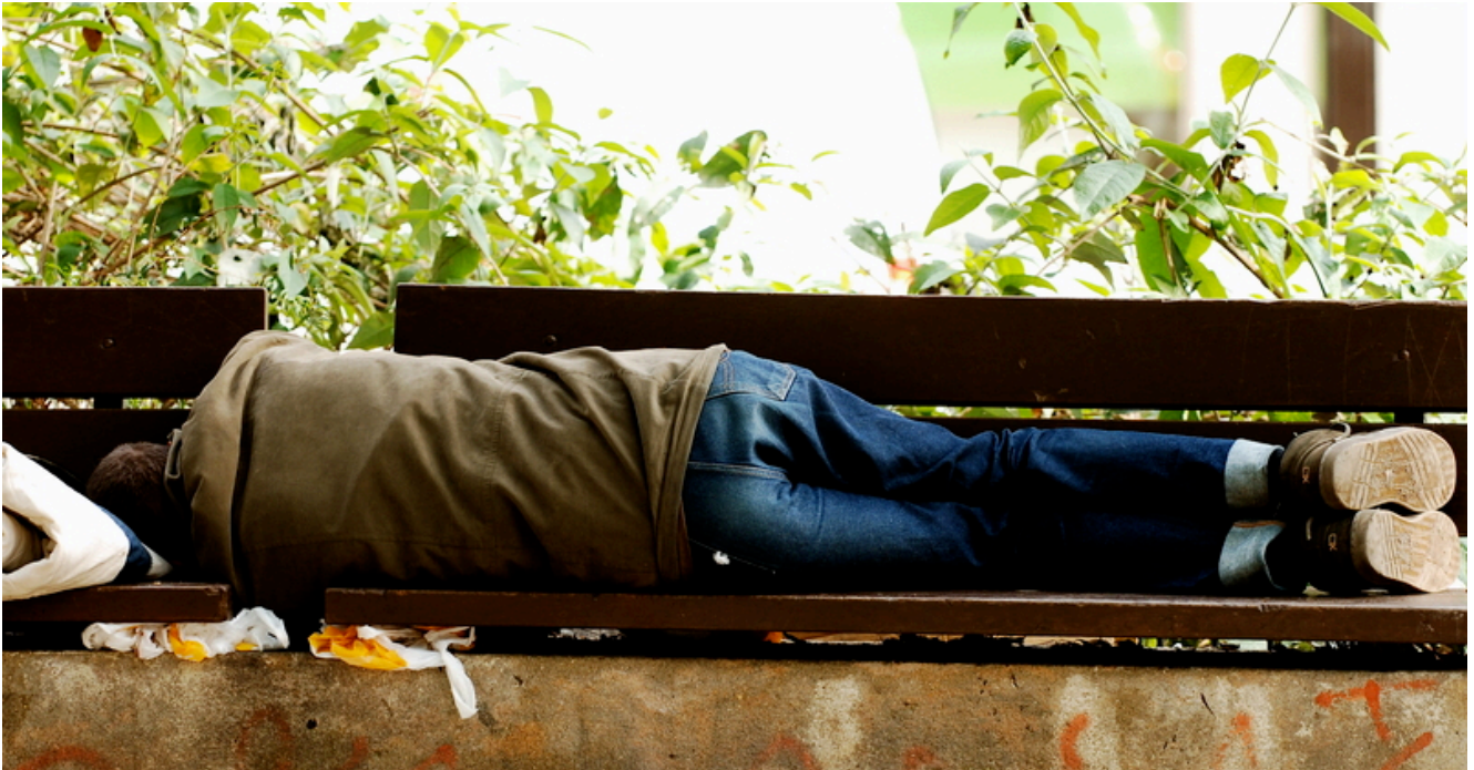
Senzatetto – Lisbona, Portogallo