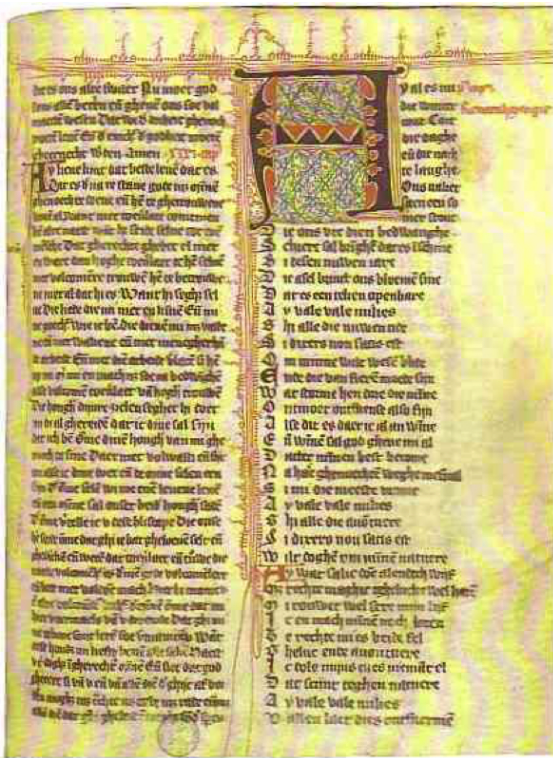
Antico manoscritto delle visioni di Hadewijch d'Anversa

Possiamo dire che la vera ragione dell'amore è un'onda che cresce sempre, senza arrestarsi mai. Ciò che appartiene alla ragione è in opposizione con quel che soddisfa la vera natura dell'amore: la ragione non può infatti portar via nulla all'amore, né a sua volta può dargli alcunché.