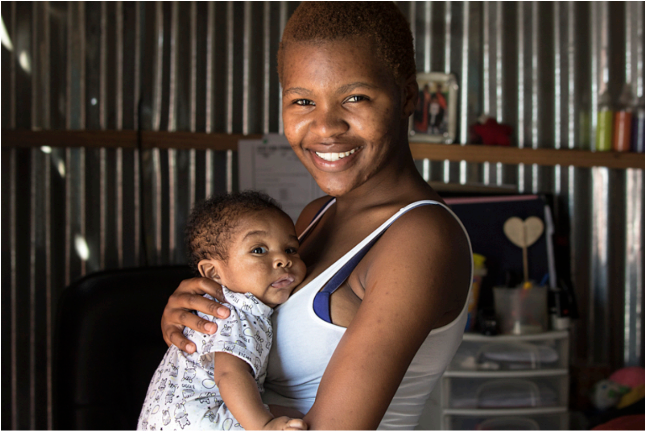
Township, Città del Capo.