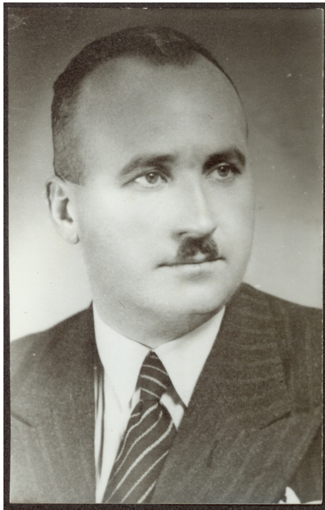
Dimitar Iosifov Peshev

Dimităr Josifov Pešev (o Peshev – 1894-1973) fu un uomo politico bulgaro che, come tanti, si lasciò affascinare dagli esperimenti totalitari nell'Europa del Novecento. Aveva iniziato la sua carriera come magistrato nel 1921 ed era poi diventato avvocato nel 1932. Nel 1935 accettò la proposta del primo ministro bulgaro Georgi Kjoseivanov di diventare ministro della Giustizia nel nuovo governo. Pochi anni dopo