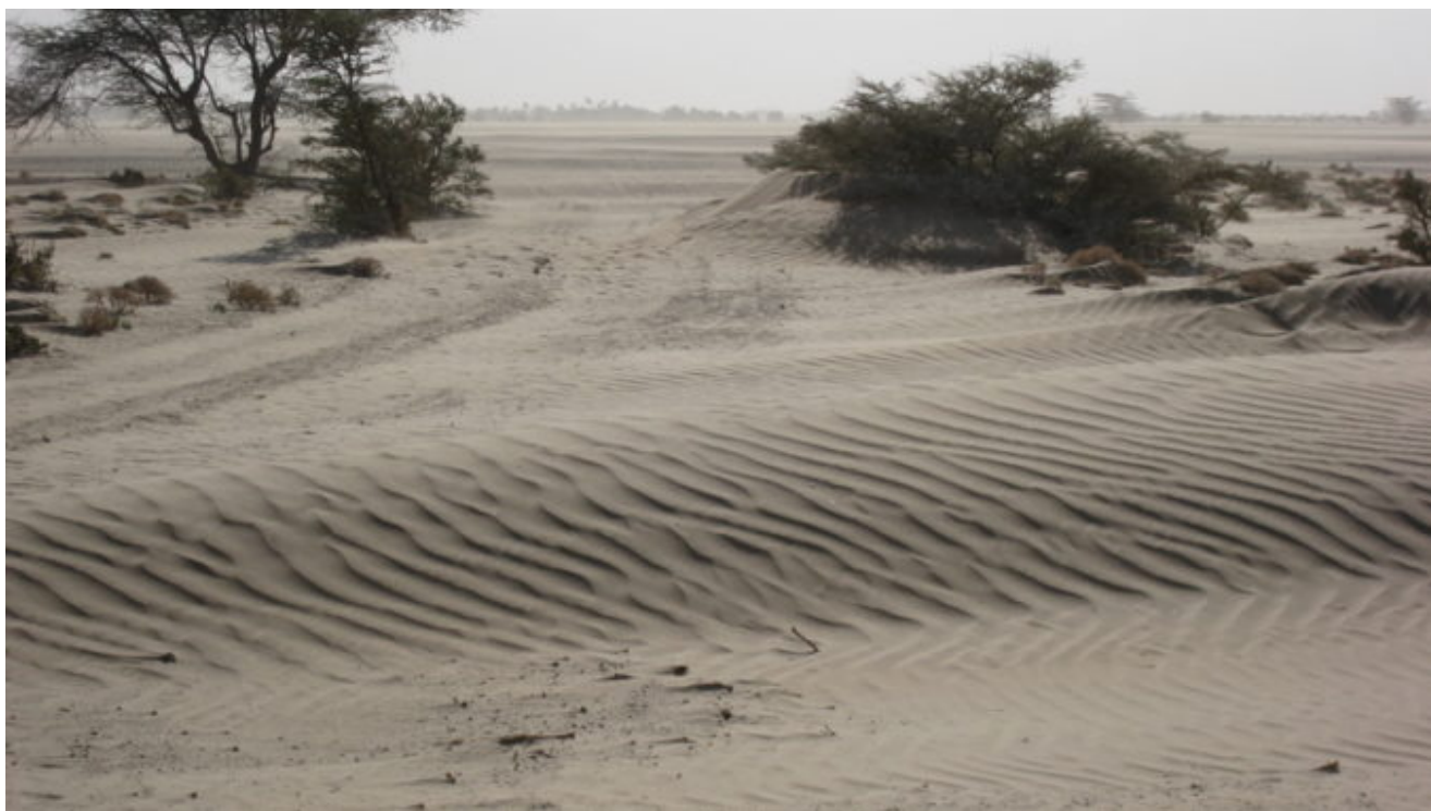
Deserto del Chalbi vicino a North Horr, Kenya.

Carbon Brief , sito britannico di informazione su clima e politiche energetiche finanziato dalla European Climate Foundation – del cui consiglio fa parte quella Mary Robinson che è stata inviata speciale Onu per El Niño e il Clima – descrive così l'effetto dell'elezione di Donald Trump alla presidenza Usa: «la più grande domanda che aleggiava sulla Cop22 era: [il nuovo presidente] deciderà di ritirare gli Stati Uniti dall'accordo di Parigi? Potrà quest'ultimo sopravvivere a un così duro colpo? Gli stornici negoziatori hanno continuato il loro lavoro nonostante una minaccia sostanziale, sebbene non confermata, incombesse. E il ritornello della conferenza è presto diventato: l'accordo di Parigi è più grande di qualsiasi paese o di qualsiasi particolare capo di stato. Saranno i prossimi quattro anni a dimostrare se è davvero così».