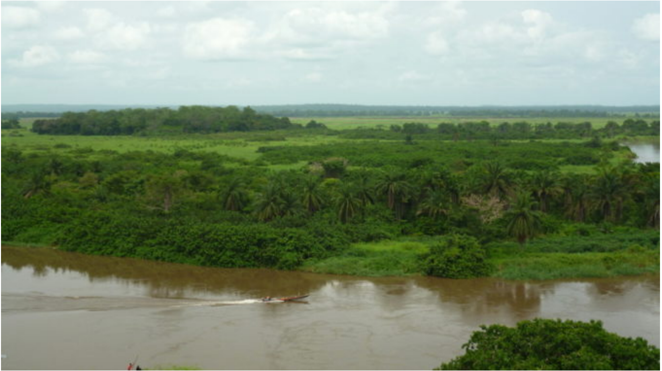
Fiume Kwanza, in Angola.