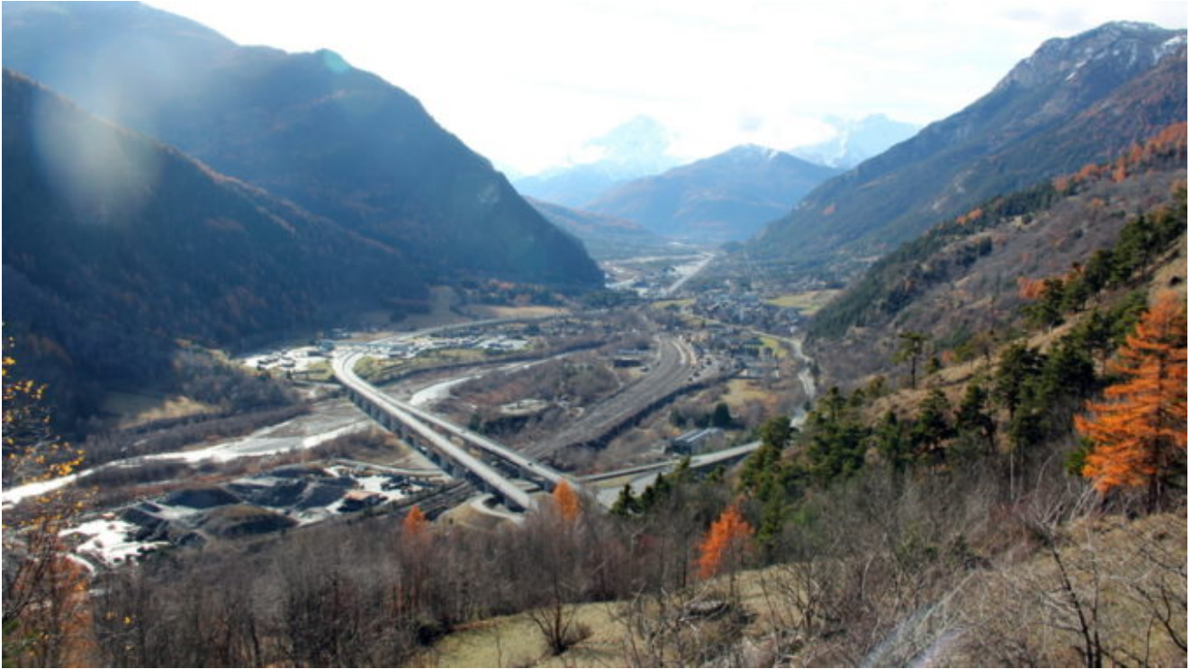
Valle Susa, Salbertrand (To)