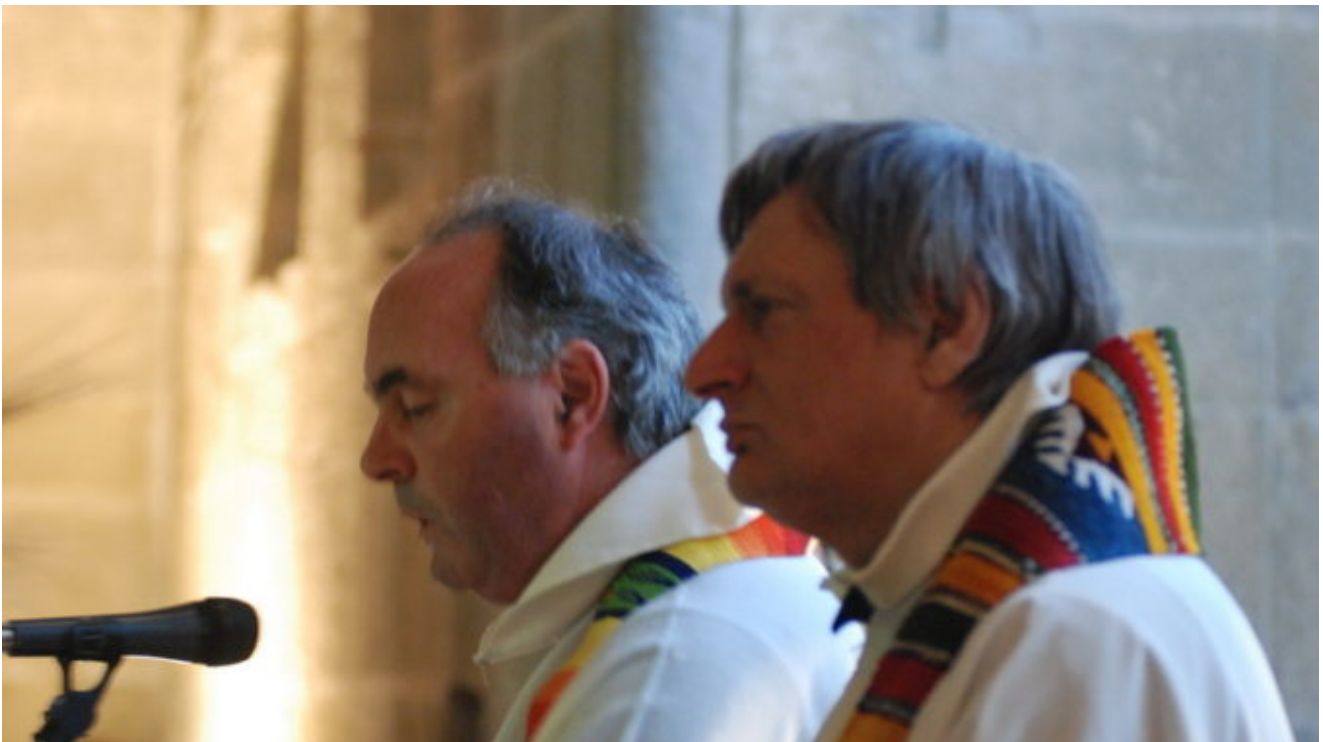
Don Luigi e Don Ciotti