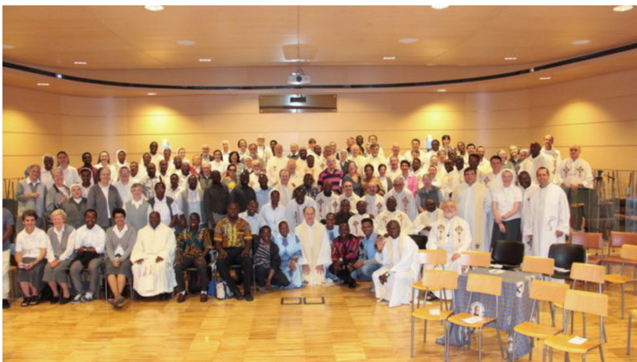
Giornata di condivisione con le Missionarie della Consolata e