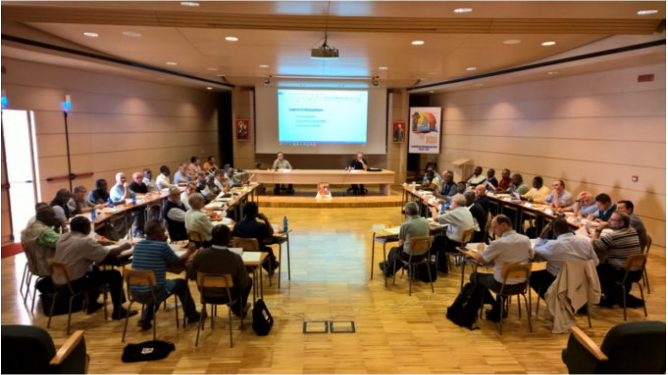
Cerimonia di apertura del 13mo capitolo generale dei Missionari della Consolata