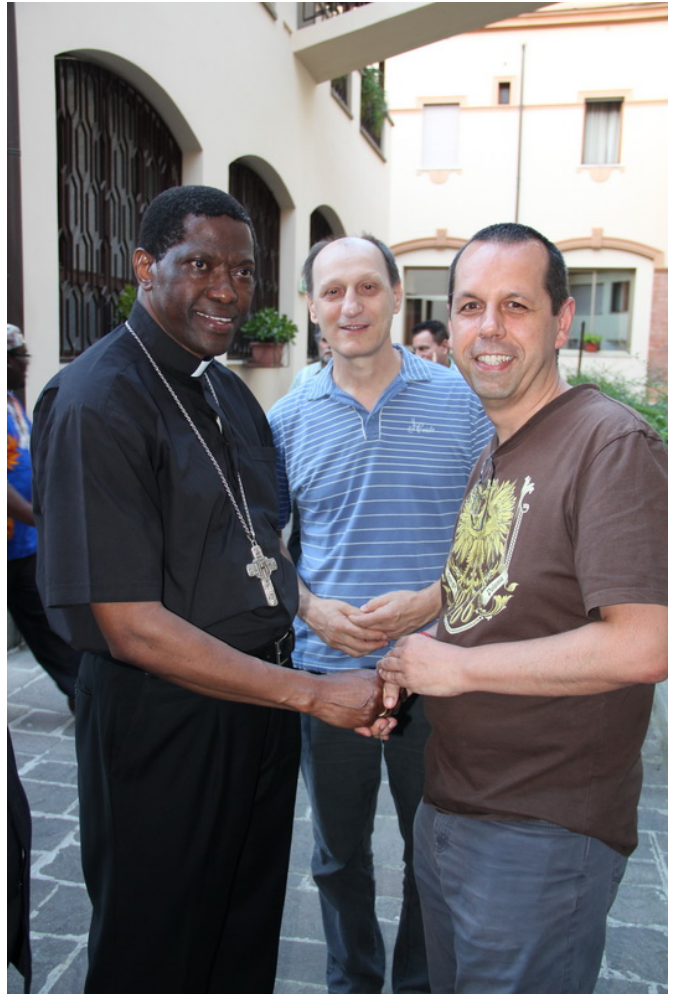
Con l'arcivescovo Rugambwa Protase di Propaganda Fide, Pontificia unione del Clero.

È venuto poi un altro nostro superiore diretto, l'arcivescovo Protasio Rugambwa, ( foto 10 ) tanzaniano, presidente delle Pontificie Opere Missionarie. A conoscenza del nostro impegno di rivitalizzazione , ci ha detto che «le sfide non si possono affrontare solo con gli sforzi umani e l'azione di strategie pianificatrici, bisogna pregare e ascoltare lo Spirito Santo, che è il protagonista principale della missione».