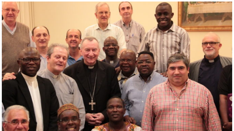
Momento conviviale a cena con il cardinal Pietro Parolin, segretario di stato del Vaticano

Il primo giorno si è concluso con la celebrazione eucaristica presieduta dal cardinal Pietro Parolin, segretario di stato della Santa Sede (foto 4). Le sue parole sono andate dritte al cuore del capitolo: «Credo che il desiderio di ristrutturare il vostro istituto vada inteso non semplicemente come un lavoro di restyling , ma deve essere un modo autentico per portare la missione veramente ad gentes , alle persone». Nel