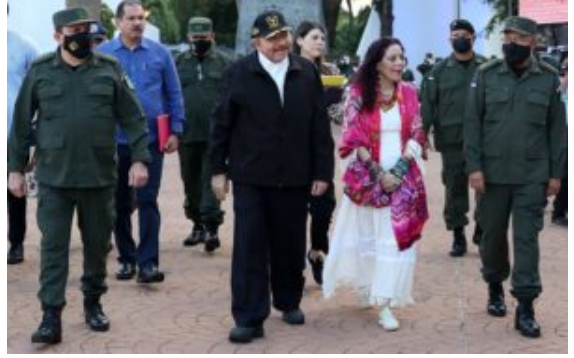
Daniel Ortega e Rosario Murillo.